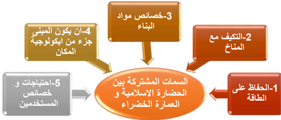
شكل ( 8 ) الاسس المشتركة بين الحضارة الاسلامية و العمارة الخضراء و المستلهمة منها

يمكن ادراك السمات التي استلهمتها العمارة الخضراء من الحضارة الاسلامية فى تصميم الفراغ لكى تكون متوائمة مع البيئة 13 ، وهذه السمات يوضحها الشكل الاتى :