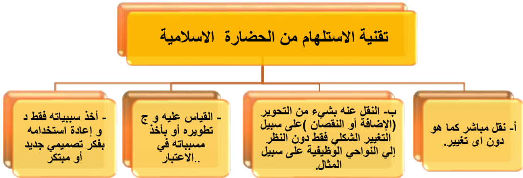
شكل ( 6 ) يوضح تقنيات الاستلهام من الحضارة الاسلامية

ويمكن تصنيف تقنية الاستلهام من التراث فى الاساليب التى يوضحها الشكل التالى :