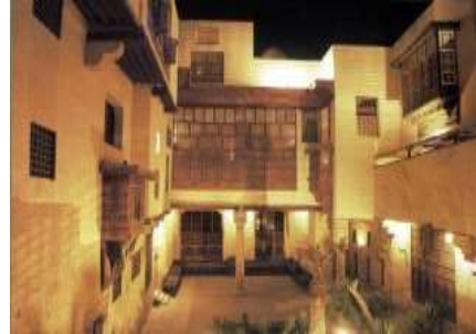
شكل ( 13 ) لفناء الداخلي لبنت السحيمي