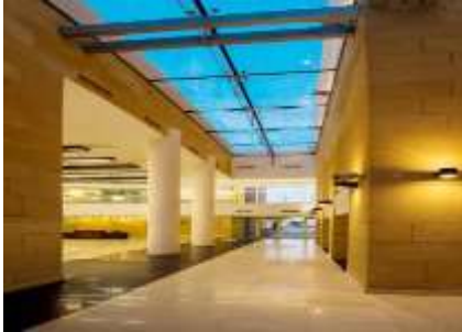
شكل ( 14 ) الأتريوم في العمارة المعاصرة

- طورت الدول الغربية التي تتسم بطقسها البارد فكرة الفناء فيما يعرف حاليا بـ "الأتريوم".